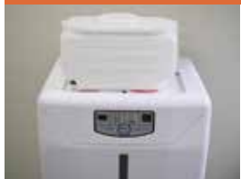
専用カートリッジ (7ℓ) 2～3回で満タン