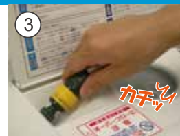
③ うるおリッチ本体へ 給水ホースを接続