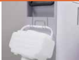
給水後は専用フックに かけて保管