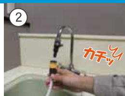
② 付属の給水ホースを アダプタに接続